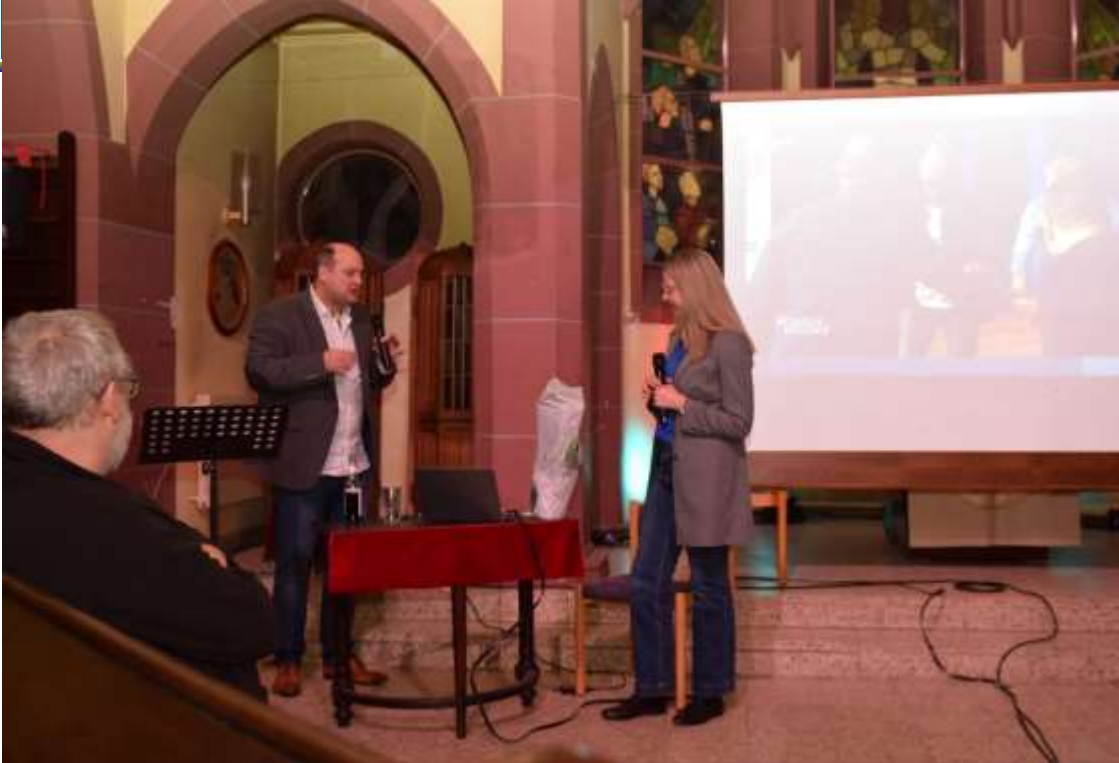
Tolle Vorträge in der Regenbogenkirche