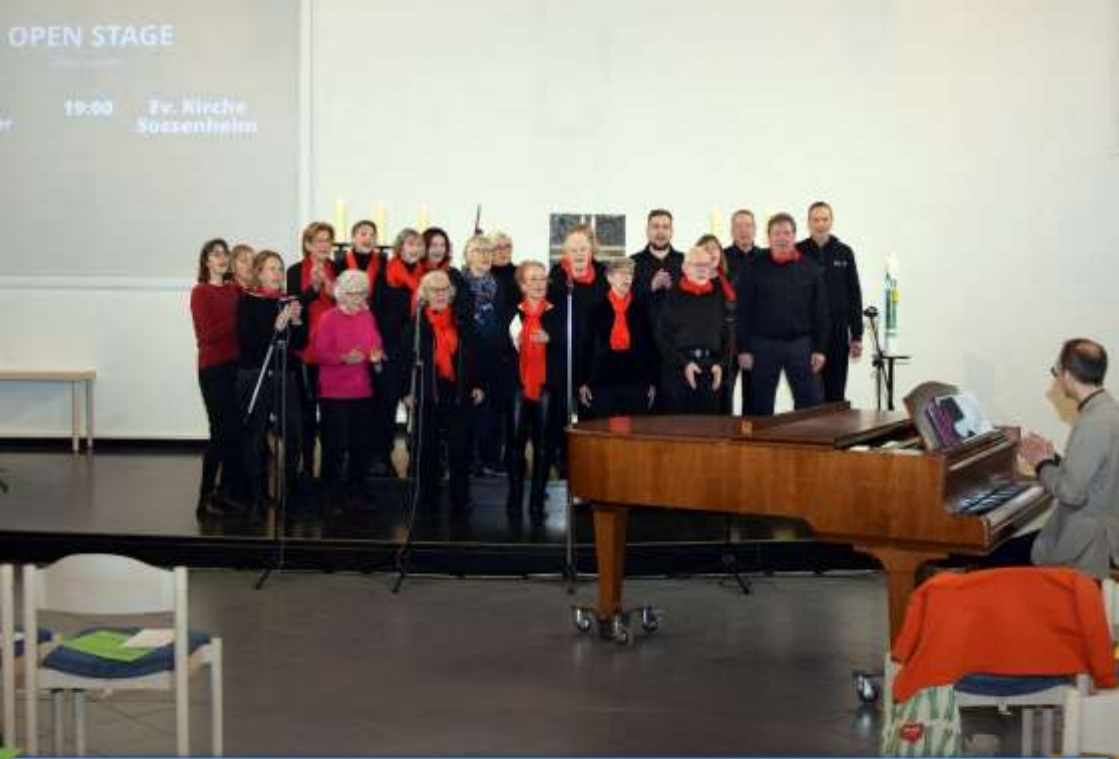
Einführung des Verkündigungsreams am 8. Februar 2026